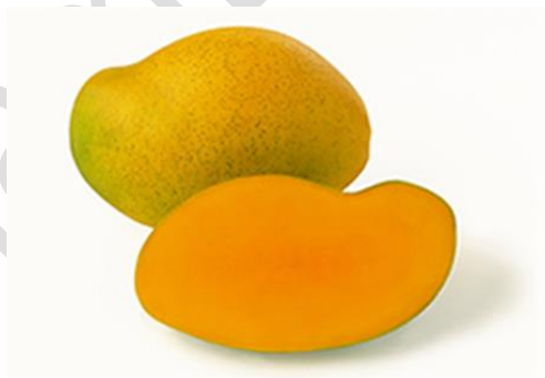
Nguồn: Hội đồng Xoài Hoa Kỳ

Xoài có vị ngọt đậm, thường được trồng ở các nông trại nhỏ ở Haiti, mềm, nhiều nước, màu sắc vỏ vàng sáng cùng với màu xanh, hình dáng quả là hình chữ nhật, hình cong 2 hướng chữ S. Khi chín xoài chuyển từ màu xanh sang màu vàng và khi chín đều thì vàng hơn màu kim loại. Mùa xoài này bắt đầu từ tháng 4 đến tháng 6.